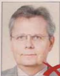
Kontrast durch Überbelichtung