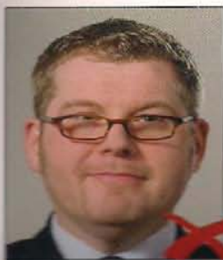
Blickwechsel - verdeckt Augen