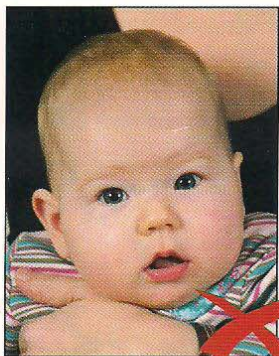
Zweite Person im Hintergrund