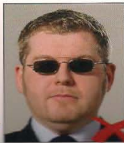
Blickwinkel zu Kamera