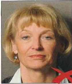
Schatten im Hintergrund