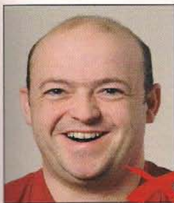
Mund zu weit offen