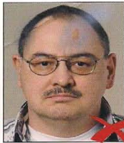
Knicke und Tintenflecke im Bild