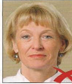
Hintergrund ohne Kontrast