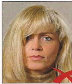
Haare im Gesicht