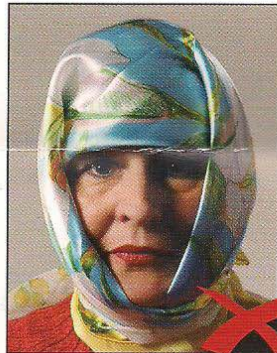
Schatten im Gesicht