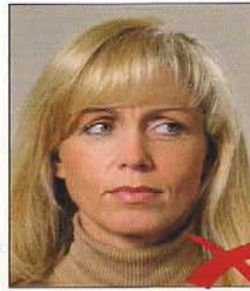
Blick zur Seite