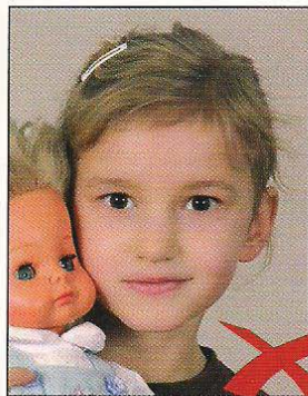
Gegenstand im Bild